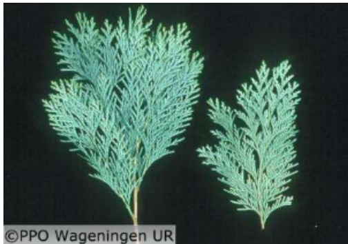
Chamaecyparis lawsoniana 'Alumii' links controle, rechts stikstofgebrek (1e groeiseizoen)