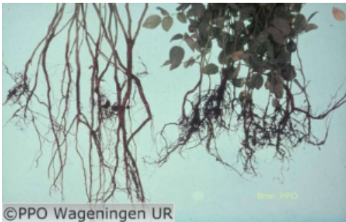
Bossig wortelstelsel Ribes