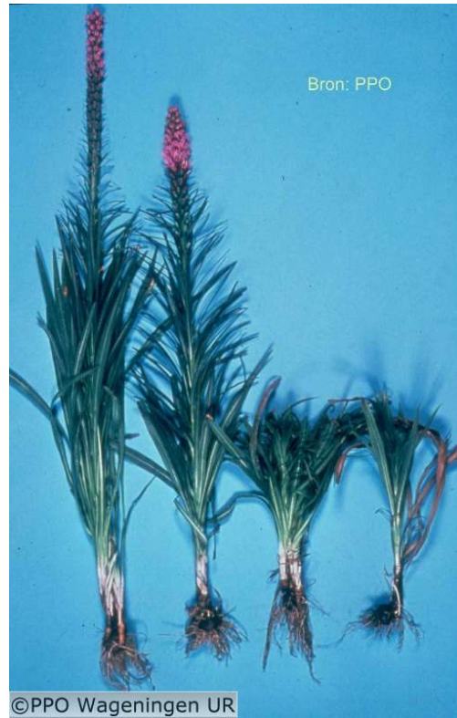
Achterblijvende groei, Liatris